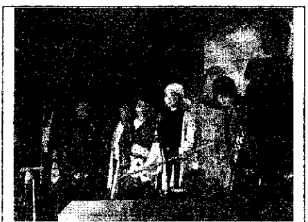
4年生『お江戸に水がやってきた』