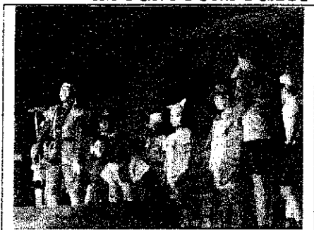
5年生『樗次郎の冒険』