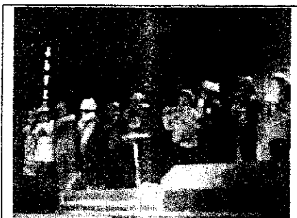
2年生『ガラバラゴラスを やっつける』