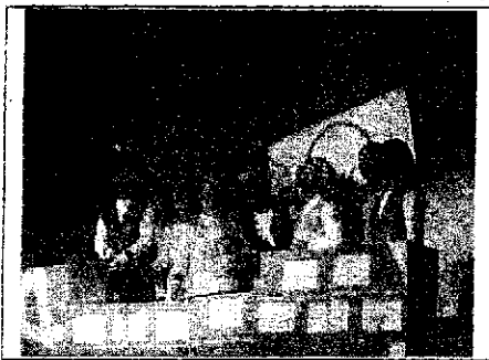
3年生『おかしなすきなかいぞくの おかしなおかしなおかしなたび』