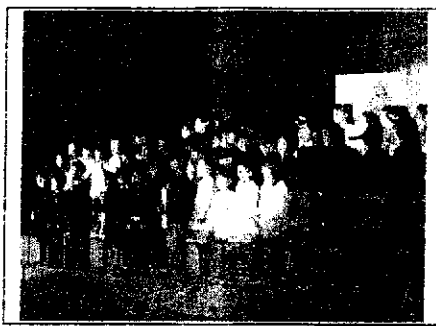
1年生『わっしょいわっしょい ぶんぶんぶん』