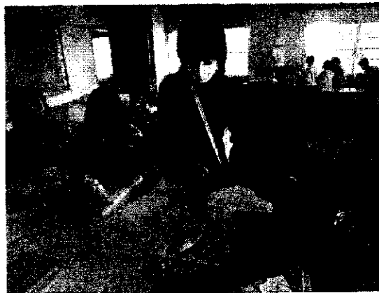
お手伝い名人を目指して仕事のこつを教えてもらいました。