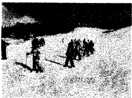
ホテル前でのスキー講習の様子です。