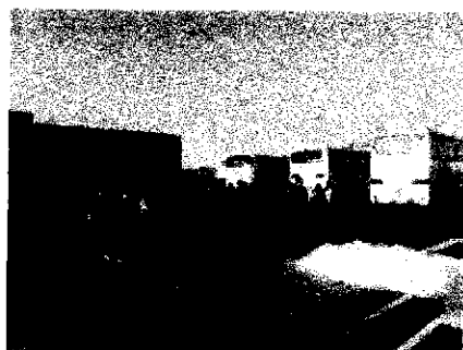
東京も雪が残っている。

高速道路で軽井沢付近に来ると雪で山が白く輝いていました。19日と20日に大雪が、降っていたそうです。21日の午後にホテルに到着し、昼食・着替えてスキー講習となりました。大雪のおかげで、スキー講習は、問題なく実施できました。3日間とも天候が良く、楽しいスキー教室ができました。