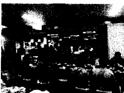
1日目の夕食の様子と食事内容です。