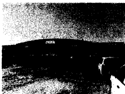
サービスエリアも雪がありました。