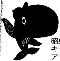
昭島市公式キャラクター アクキー

詳しい催し案内は、市ホームページ、または、8月初旬に新聞に折り込むチラシをご覧ください！