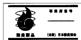
防炎製品ラベルの例