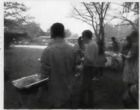
おいしく食べました

内容は、参加者の付き添 いや簡単な運営の手伝いな どで、都合のつく範囲で構 いません。興味のある方、活動 に参加してみたい方がいらっ しゃいましたら一度見学にお 越しください。