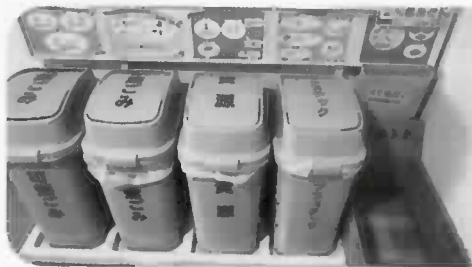
公民館ごみ箱(6月末日現在)

昭島市では、ごみを資源としてリサイクルするために、市民館でも燃えるゴミとプラスチック類、紙類、雑紙、分別する取り組みをしています。燃えるゴミの量を減らす取り組みを、皆様のご協力を願います。