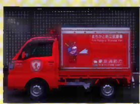
まちかど防災訓練車

木造密集地域や狭い道路にも入っていきけるよ。水タンクを積載しているからどこでも放水訓練ができるよ！詳しくは消防署に聞いてね。