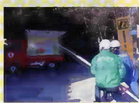
実際に放水できます