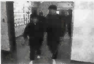
ブラインドウォーク

2年生は、9月から福祉学習に取り組んでいます。その一環として、「ハンディキャップ体験」を、市内のボランティアグループ「アイ・ハート」の皆さんをお招きして行いました。当日体育館は、冬のような肌寒さでしたが、皆真剣な態度で臨んでいました。