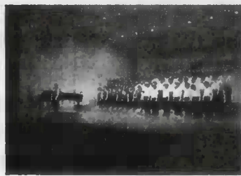
2年学年合唱 パートリーダー合唱