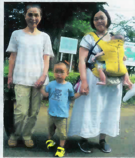
事前打ち合わせの様子