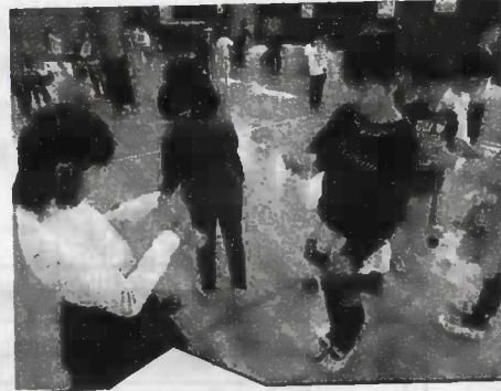
2年生に、コマ、けん玉、めんこ、だるま落としを教えてもらいました。