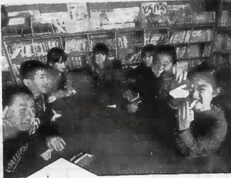
青年交流では、ケンダーさんから、サンタさんの折り方を教えてもらいました。

3学期は、1年間のおまとめをし、2年生に向けての準備をする大切な時期です。更に心身ともに大きく成長できるよう指導・支援していきます。