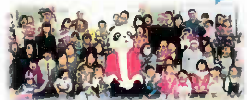
ファミサポ交流会