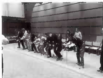
キャッチング・ザ・スティック体験

「ヘア・リンク・キャッチ」を体験しました。終了後は懇親会もあり、生涯学習推進のための連携を図る良い機会となりました。