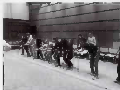
キャッチング・ザ・スティック体験