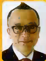
講師 山田五郎氏 (評論家)