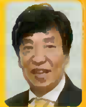
講師 白井伸介氏 (昭島市長)