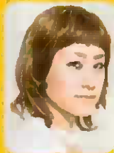
コーディネーター IMALU氏 (タレント)