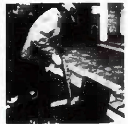
消火栓に差し込む