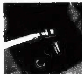
スタンドパイプとホースをつなぐ