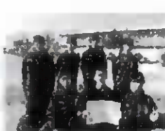
男子バスケット部