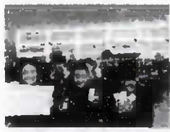
女子バスケット部