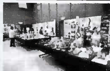
(過去の会場の様子)