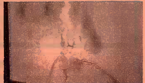
トラッキング現象により出火したプラグ

代表的な電気火災のうち、 トラッキング現象 があります。トラッキング現象とは、コンセントに差し込んだプラグの差し刃間に付着した綿埃等が湿気を帯びて微小なスパークを繰り返し、やがて差し刃間に電気回路が形成され出火する現象を言います。