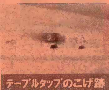
テーブルトップのこげ跡