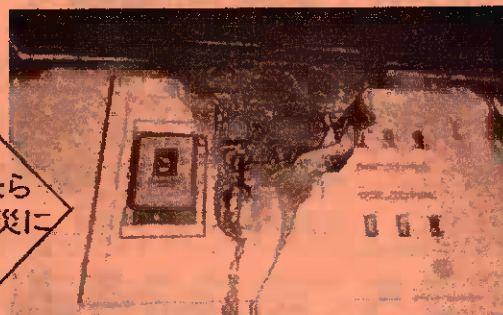
ブレーカーが燃えた火災