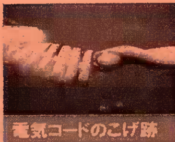
電気コードのこげ跡