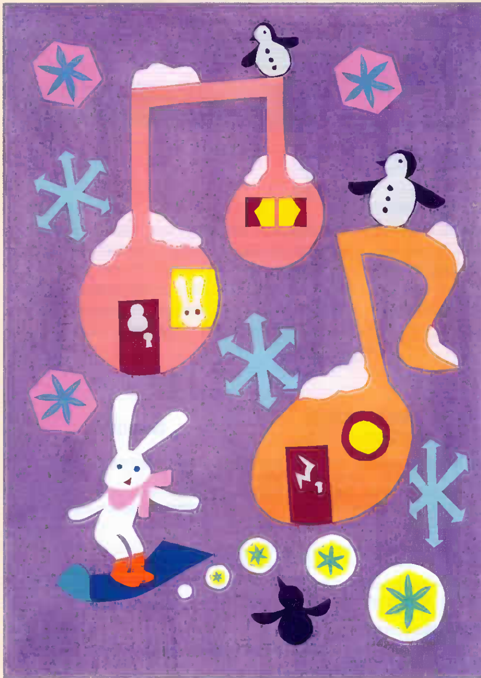
「音符の家 冬」OSACO.T Artbility ※この作品は障害者アーティストによる作品です

お寄せいただいた募金はこの地域の福祉活動に使われます。 詳細は赤い羽根データベース「はねっと」でご覧になれます。