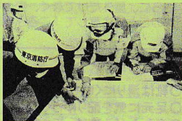
令和2年12月震災訓練の様子

「防災とボランティア週間」を通じて 一人一人が防災に関する意識を高め 災害に備えましょう！！