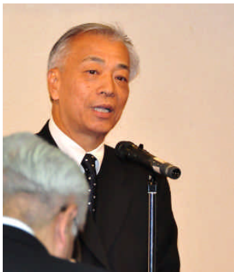
来賓挨拶をする昭島警察署・江崎副署長(同上)