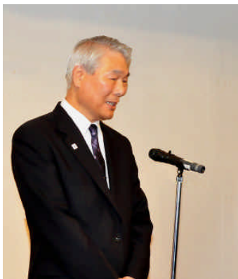
来賓挨拶をする佐藤昭島副市長(同上)