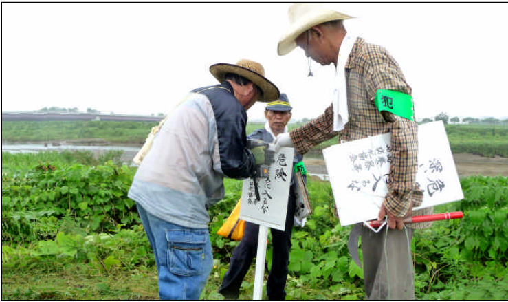
「危険 深い所に入るな」の立て看板を設置する参加者

7月8日(日)多摩川危険箇所点検が昭島警察署・昭島防犯協会合同で行われました。 夏休み中の水の事故防止等のために行うもので、当日は警察官、多摩川流域の6防犯支部から総勢50余名が参加しました。 作業は「マムシに注意!」「危険 深い所にはいるな」の掲示板を立てたり、周囲の草刈を実施しました。