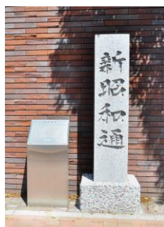
新昭利通モニュメント