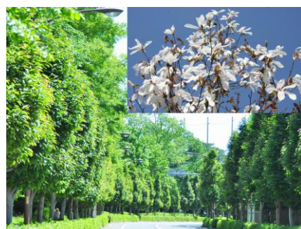
新昭利通と街路樹「ワダスメモリー」