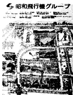
昭和飛行機グループ