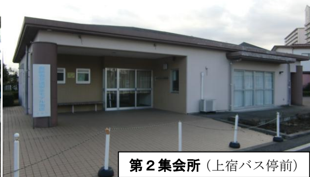
第2集会所(上宿バス停前)