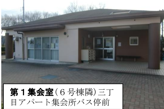
第1集会所(6号棟隣)三丁目アパート集会所バス停前

頑張れ、新成人！！ 前途に幸多かれ！！ 応援しています！！ おめでとうございます。