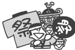
昨年の合同巡行に集まった各自治会のみこし（日の出公園）